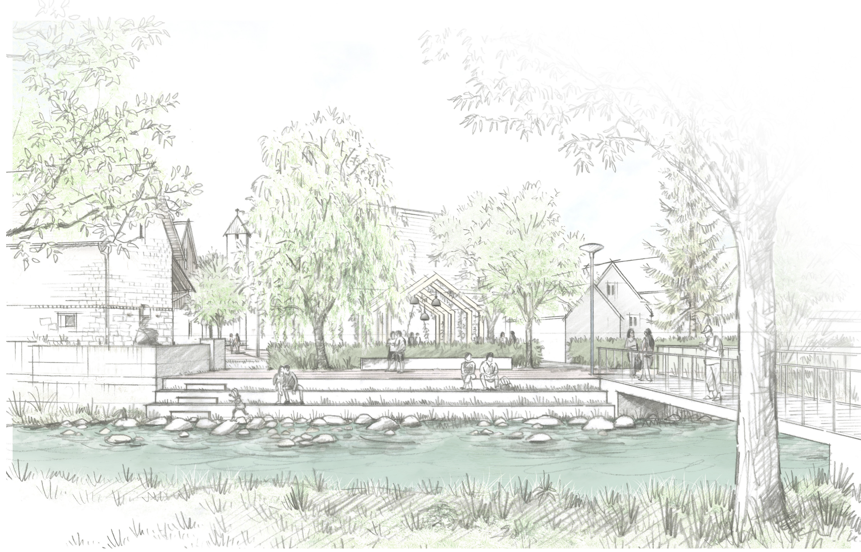
Platz am Wasser