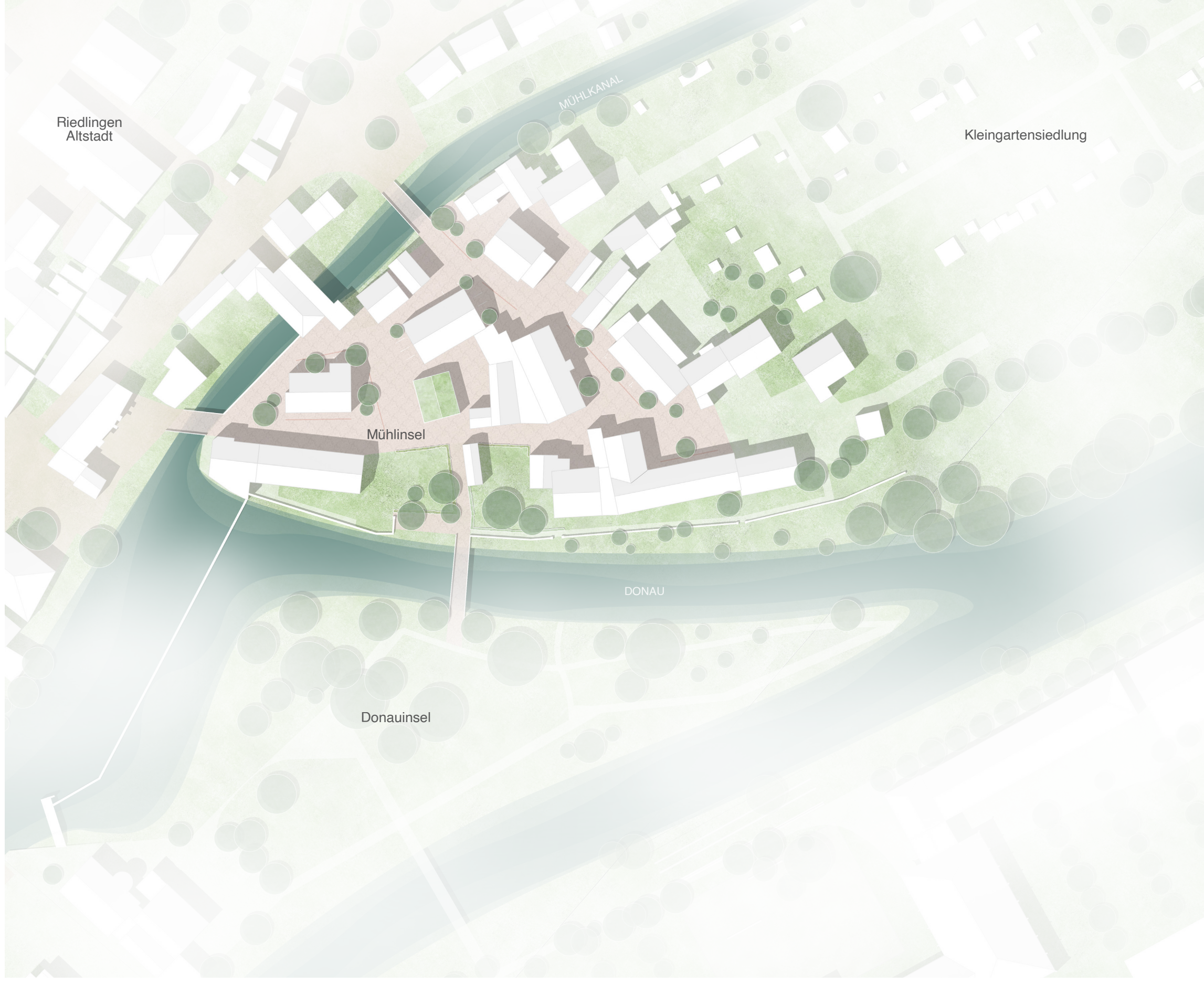
Übersichtsplan 1: 1000