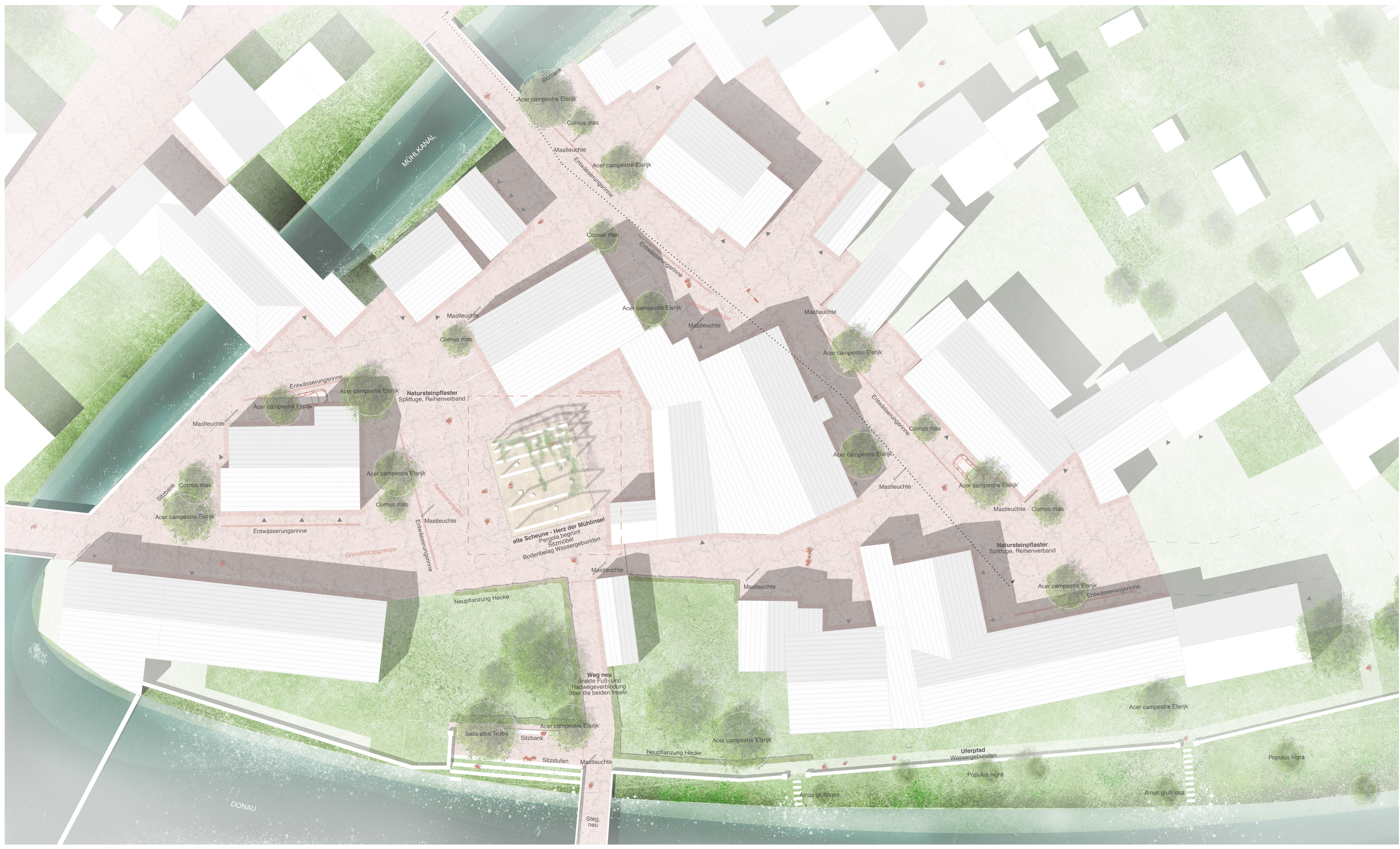
Lageplan M 1: 200