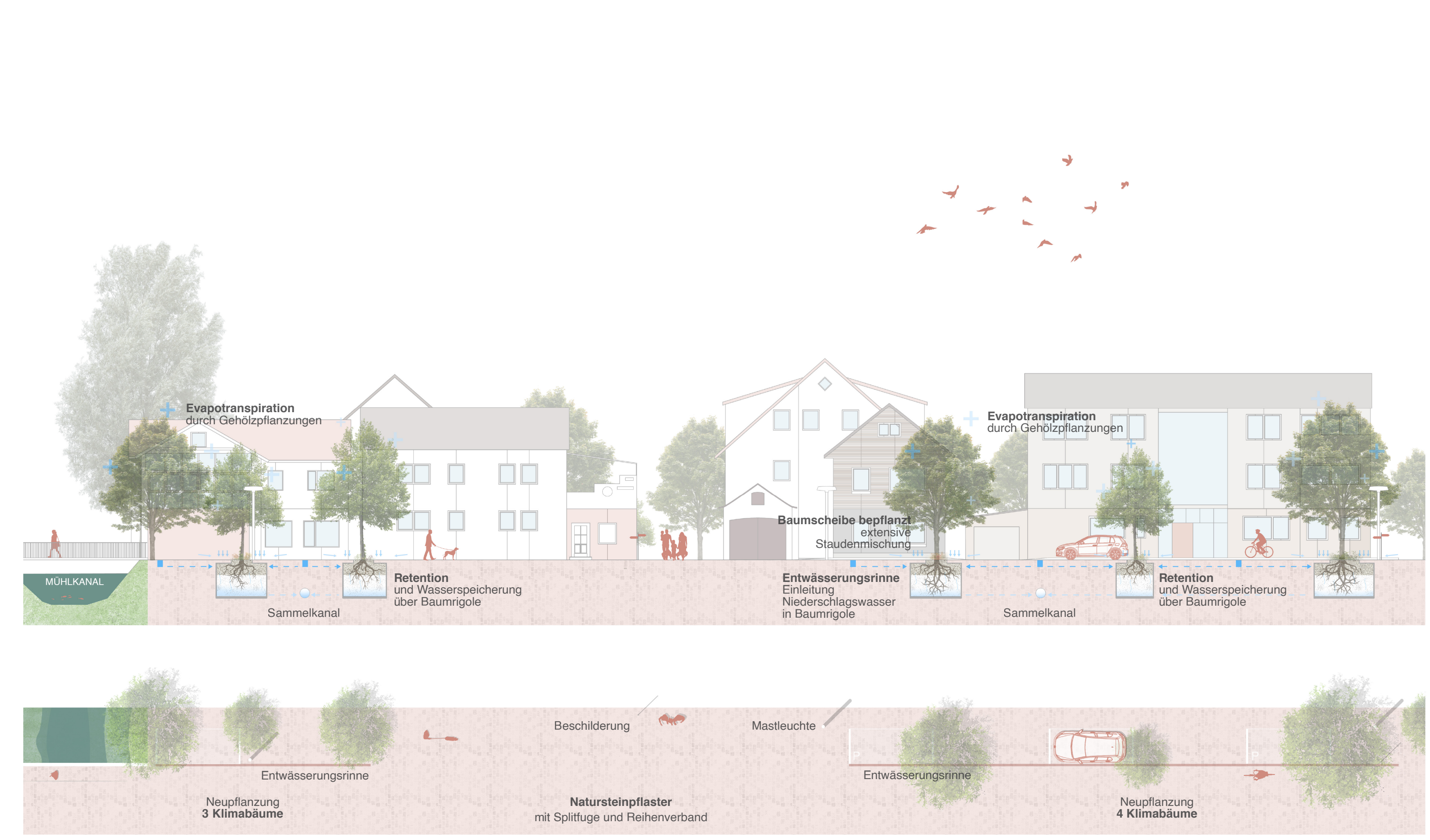
Schnittansicht M 1: 200